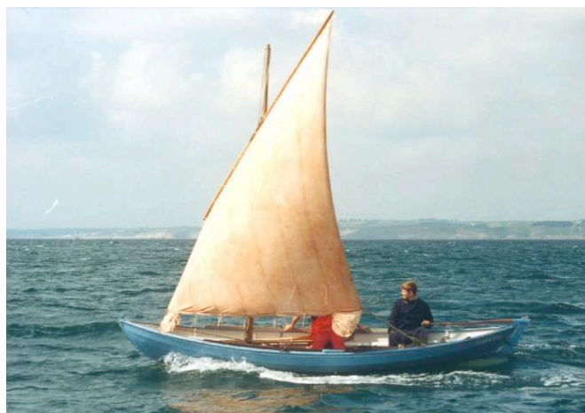
Voile au tiers amurée en abord

Kits (contreplaqué, bois massif) et toutes fournitures peuvent être obtenus auprès de Icarai : 4 avenue Louis Lumière - 50100 Cherbourg Tél : 02 33 41 38 91 - E-mail : nvivier@icarai.net