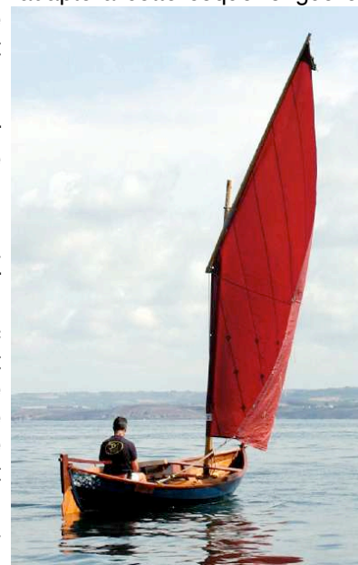
Voile au tiers simple