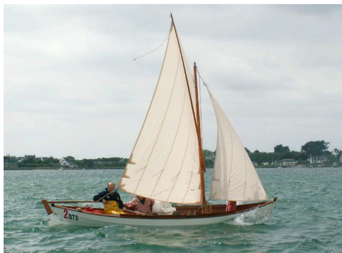
Grément à livarde

Youkou-Lili a été proposé ensuite sous forme de dossier de construction et le nom de mon bateau est devenu nom de la série. L'un d'eux a gagné dans sa catégorie une édition du « Great Glenn Raid » en Ecosse, confirmant les qualités exceptionnelles du